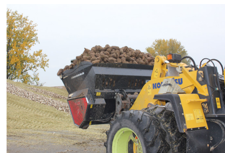
in 4 verschiedenen Größen lieferbar