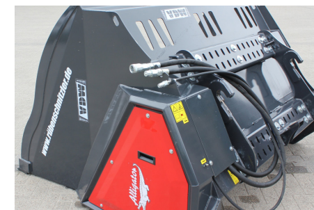
Sichtfenster und Schlauchgarderobe