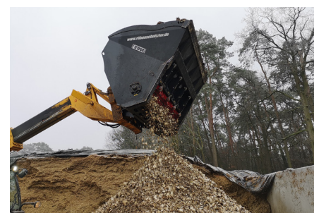
Schnitzelgröße variabel einstellbar