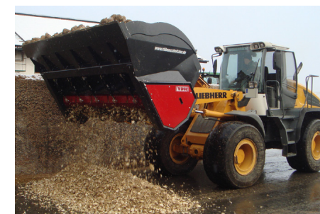
RS 3000 verarbeitet 3 Tonnen in ca. 1 min