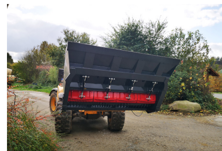
Gegenschneiden mit stufenloser Spindelverstellung