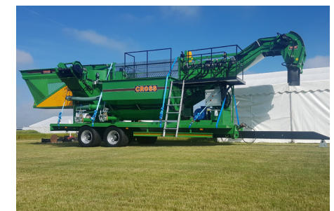
Rübenwäsche Moose mit patentiertem Einsteinszyklon