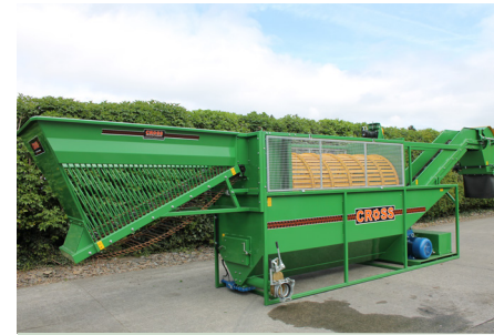
stationär oder auf Tieflader