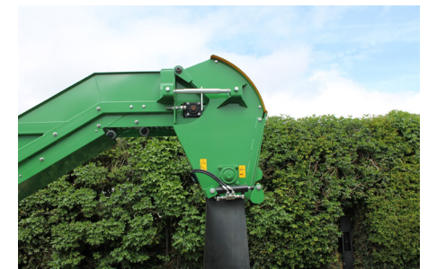
Schnitzelleistung bis zu 45 t/h